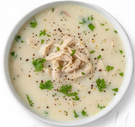
11. Tavuk (A, C) Hühnersuppe