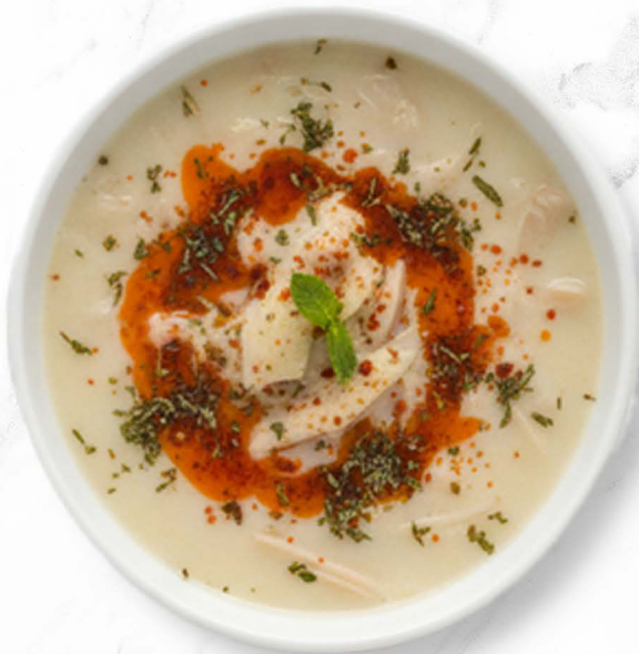
12. İşkembe (C, G) Pansensuppe