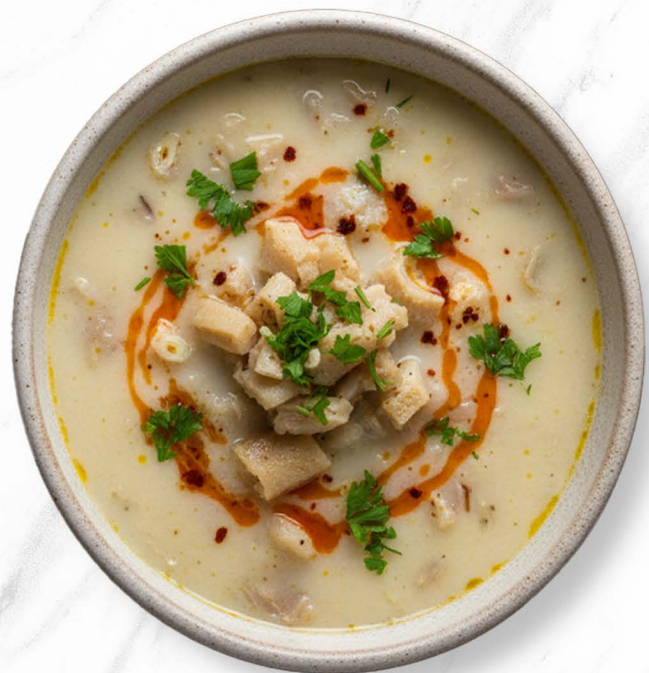
13. Dil Çorbası (C, G) Zungensuppe