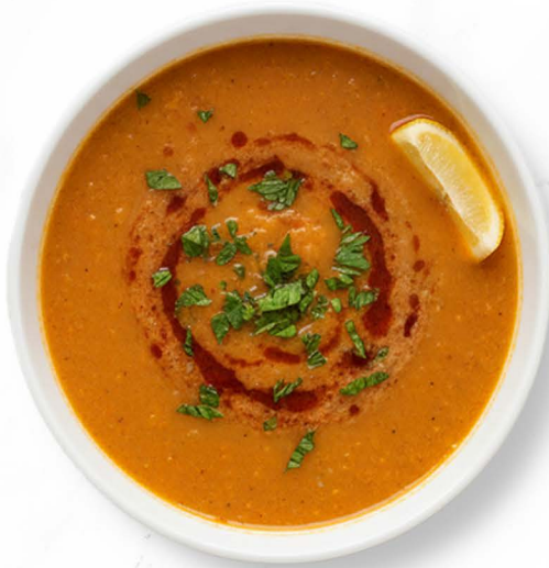
10. Mercimek (A, G) Linsensuppe